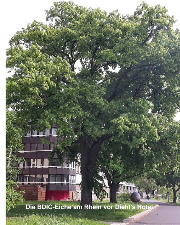
Die BDIC-Eiche am Rhein vor Diehl's Hotel

Die 850 Meter lange Panoramabahn über den Rhein erlaubt einen spektakulären Blick auf Koblenz. In wenigen Minuten erreicht der Besucher so die imposante Festung Ehrenbreitstein mit zahlreichen Ausstellungen und das Landesmuseum zurzeit mit der Familienausstellung „Willkommen @ Hotel Global“.